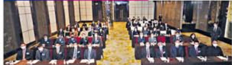
▲《香港全光產業研討會》由香港通訊業聯會（CAHK）主辦，由華為贊助及支援，於2022年12月19日舉行。研討會匯聚多間本地頂尖電訊企業，透過主題演講、行業洞察及專業討論，共同探討在數字經濟發展底下，企業如何作好準備，迎接未來的各種機遇及挑戰。