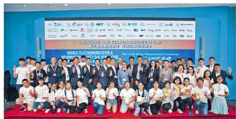
▲「2019香港世界電訊及資訊社會日」主題為「攜手推動數碼共融 你我同創智慧城市」。本會於2019年3至5月舉辦了一系列活動，把大會主題訊息直達社會大眾。相片攝於5月11日舉行的「香港世界電訊及資訊社會日」頒獎典禮。

在通訊事務管理局的支持下，加上得到資訊科技界的贊助，香港通訊業聯會自2007年開始主辦「香港世界電訊及資訊社會日」，務求提高社會大眾，特別是青少年與學界對創新資訊科技的認識及關注。