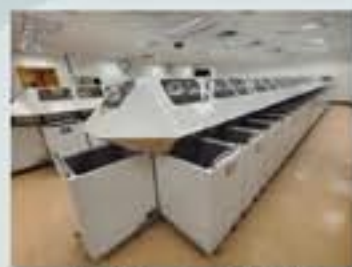
智能圖書分揀機 EXPRESS Smart Sorter