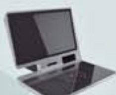
自助借還書機 Self Check in & out station