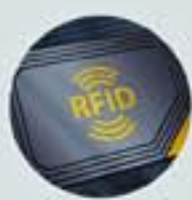
UHF RFID 圖書標籤 UHF RFID Tagging Service