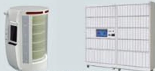
智能自助借書站/借書櫃 Smart Dispenser / Locker